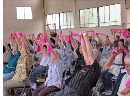
富津市吉野地区社会福祉協議会 「ふれあいサロンよしの」における体操の様子