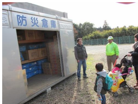
芝山町菱田地区社会福祉協議会 「ふれあいサロン 第1回歩いて食べよう会」の様子