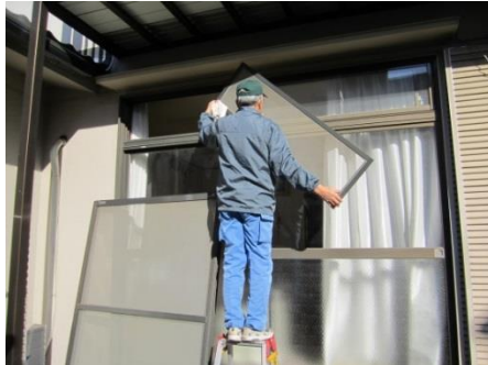
茂原市北部地区社会福祉協議会 「萩の里たすけあいサービス」による網戸清掃の様子