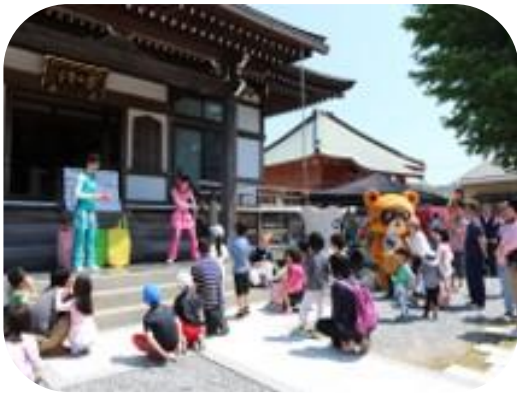
木更津市岩根東地区社会福祉協議会 「岩根こどもフェスティバル」