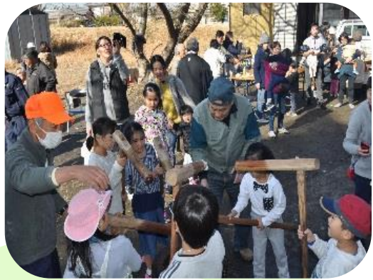
一宮町西部地区社会福祉協議会 「ニコニコ広場」の餅つき