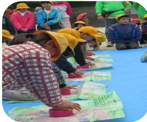
八街市八街北地区社会福祉協議会 「合同防災訓練」による胸部圧迫体験