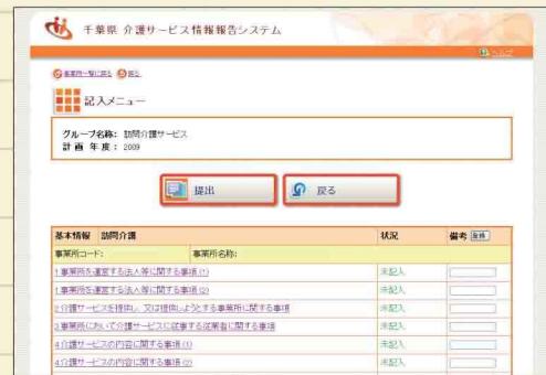
▲介護サービス情報報告システム

さらに、今年度からは、調査情報の中でマニュアルや規程等の存在が前年度の調査で確認されている項目については、今年度の確認作業は行わない等の調査方法の簡素化が図られています。