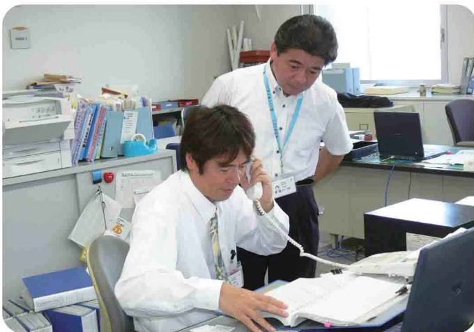
社会福祉課に設置されている〈見守りネットワークセンター〉