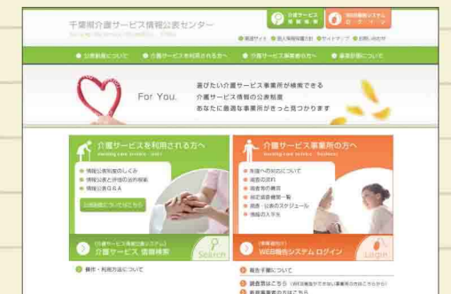
▲千葉県介護サービス情報公表センター

本センターでは、介護サービス情報の公表制度のさらなる周知と活用を促進するため、本年8月にホームページをリニューアルするとともに、公表されている情報をどのように読み取るのかを紹介した「介護サービス情報の公表調査票の見方」を作成しました。内容は本センターのホームページに掲載していますのでぜひご覧ください。