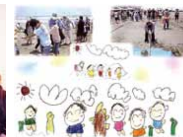
子どもたちのために〈千葉市〉