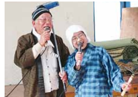
望年会（新しい年に希望を託す会）

とが現在の悩みとのこと。今後、男性を含めてもっともっと輪を広げていきたいとのこと。