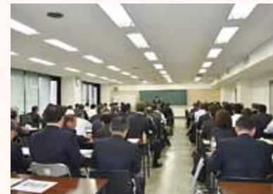
熱心に説明を聞く参加者

その後、千葉県より平成26年度の県における地域福祉関連事業及び国の施策の動向等について説明があり、本会からも今年度の事業計画及び市町村社会福祉協議会が取り組む方向性について説明を行いました。市町村行政と社会福祉協議会とが互いの動向について把握し、今後の地域福祉推進の方向性について共有する機会となりました。