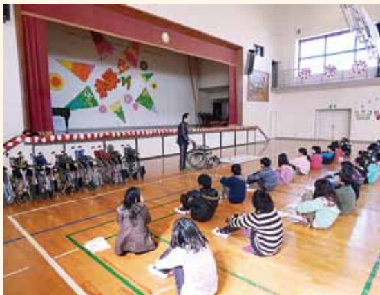
(上)浦安市の新規採用職員研修内で実施された福祉体験や (下)茂原市内の小学校での福祉体験学習にも利用されています。