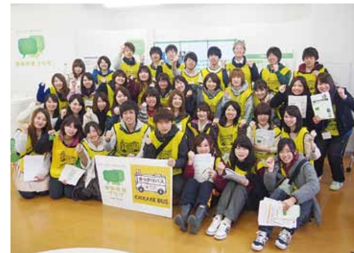
きっかけバスに参加されたみなさん