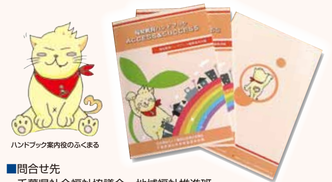
ハンドブック案内役のふくまる

■問合せ先 千葉県社会福祉協議会 地域福祉推進班 TEL 043-245-1102 FAX043-244-5201 業務時間/月曜~金曜 8:30~17:15