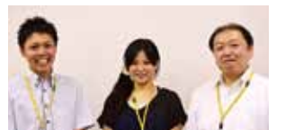
介護サービス情報公表センターのスタッフ

千葉市中央区千葉港4-3(千葉県社会福祉センター内) 電話 043-245-2344 FAX 043-244-5201 e-mail: kohyocenter@chibakenshakyo.com 業務時間/月曜~金曜 8:30~17:15