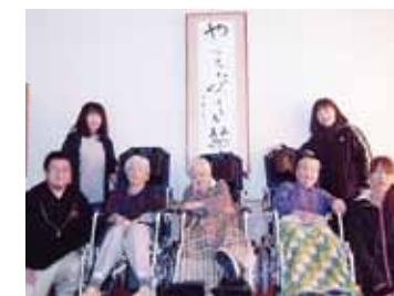
お年寄りのために〈富津市〉

東日本大震災義援金の受付は平成26年3月31日をもちまして終了いたしました。千葉県内で3億円超の募金を頂戴し、皆さまのあたたかいお気持ちは全額被災地・被災者へお届けしています。長期間に亘るご協力に心より感謝申し上げます。 災害義援金(H26年3月31日現在) ・東日本大震災義援金 304,539,302円 ・茂原市台風26号義援金 1,536,772円