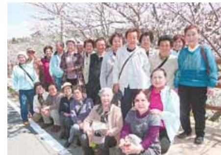
花見会（鋸南町 佐久間ダムにて）