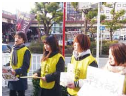
駅前の寄付金集め

もう1つの役割、寄付金集めにはとにかく苦労しました。まずツイッターやフェイスブックを使って、各県のリーダーの方々と情報交換をして、寄付金集めの方法を模索したり、以前からお世話になっている、地元の四街道市社会福祉協議会にも足を運びました。実は初めて寄付をしてくれたのが、ここで相談に乗ってくれた方でした。また、そのほかの市町村社会福祉協議会にも足を運び、アドバイスなどをいただきました。