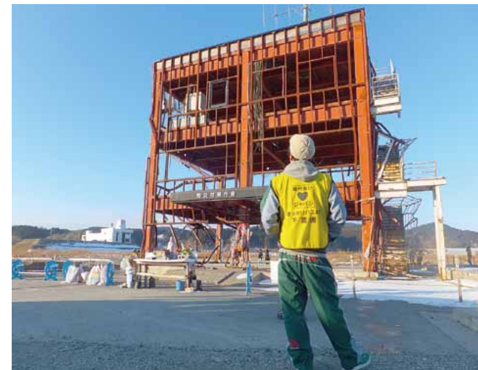
南三陸町、防災対策庁舎の前に

報告会ではスライドを作り、事前活動から現地での活動を報告しました。今は、関わってくれた1人ひとりにお礼を言いたい気持ちで一杯です。