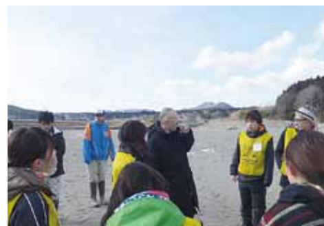
語り部からお話を聞く

そんな中で、その女性から「被災したお年寄りなどの話し相手になる活動はまだ必要だ」との話を伺い、悩みも消え、とても心が軽くなり、今後への思いを新たにすることができました。