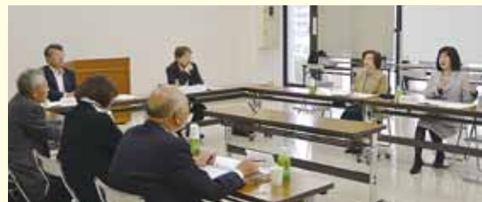
政策調整委員会の様子