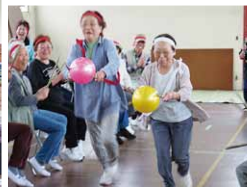
運動会（ボール送り）

福祉サービス向上のため、様々な取り組みをしている吉野地区社協ですが、事業の参加者やスタッフに男性が少ないこ