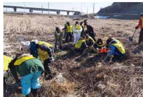
気仙沼市で遺留品の捜索