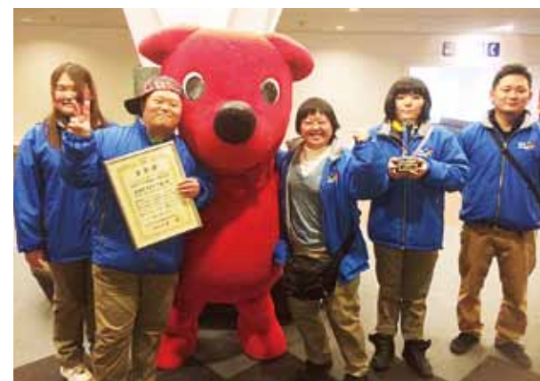
※通常の会社勤務や雇用契約に基づく就労が困難である方々に、就労や生産活動の機会を提供するほか、就労に必要な知識や訓練の場を提供します。A型とB型の主な違いは雇用契約の有無で、B型は事業者と利用者の雇用関係が成立しません。

助成金で冷蔵車をいただいたことをきっかけに始めたフレッシュジュースやカットフルーツの移動販売を行うfruit studio（フルーツスタジオ）。現在4名の利用者が、製造から販売までの全行程に関わっています。そのフレッシュジュースは昨年度、幕張メッセの国際会議場で開催された「第5回は一とふるメッセ実りの集い」において、「一とふるメッセ・オブ・ザ・イヤー 2013」の「テレビ朝日福祉文化事業団大賞」を受賞しました。