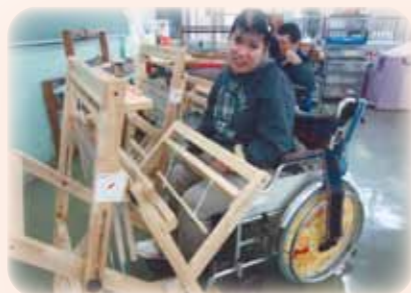
就労用品購入 生活介護事業所 (松戸市)