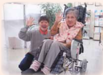
介護用品購入 特別養護老人ホーム (市原市)

社会福祉法人 千葉県共同募金会 TEL: 043-245-1721 FAX: 043-242-3338 E-Mail: c-kyoubo@akaihane-chiba.jp 千葉県中央区千葉港4-3 http://www.akaihane-chiba.jp/