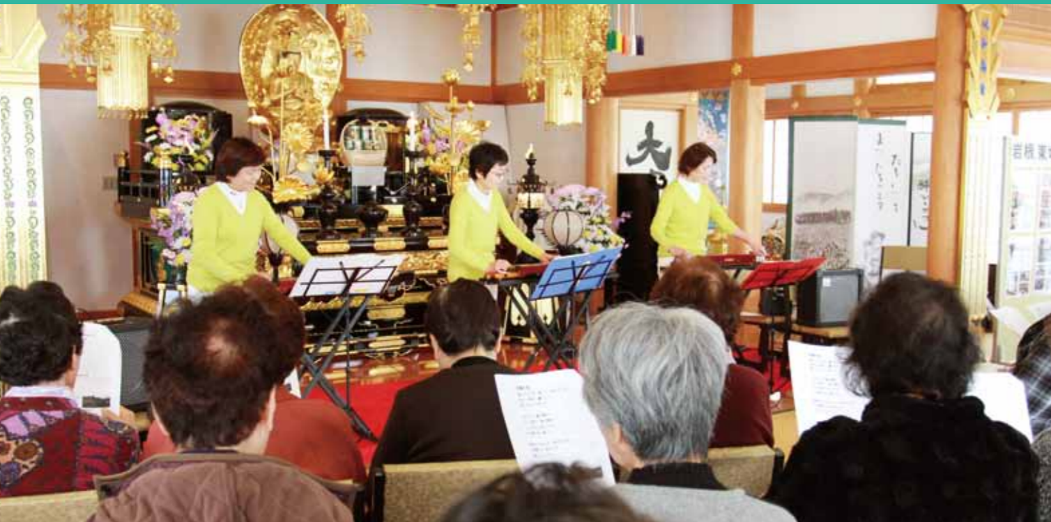
サロン新御堂寺のふれあいタイム