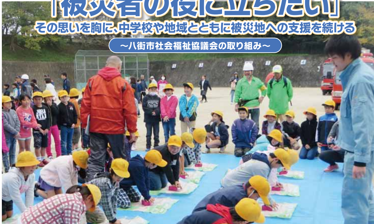
八街北小学校の防災訓練における心肺蘇生の様子

東日本大震災から5年。八街市社会福祉協議会は、震災直後から宮城県塩竈市のボランティア団体と協力関係を築き、今もなお被災地への支援活動を継続しています。また、市内の中学生が宮城県の被災地を訪れ、ボランティア活動を行う取り組みの橋渡しをはじめ、防災活動をきっかけとした地域福祉活動を展開しています。