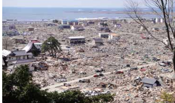
震災直後の日和山からの光景

ってもらえるようになりました。結果、私たちの取り組みに協力してくれる人が増えたと分析しています。これはこの震災によって、石巻という町がその点では大きく変わっている点だと思います。ある意味、良い方向としてそういうことがあります。だったら、今、まさにやるべきじゃないのか、と思います。