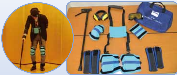
高齢者疑似体験セット

各体験セットは、本会ボランティア・市民活動センターにて、市町村社協や学校等が福祉体験学習等を実施する