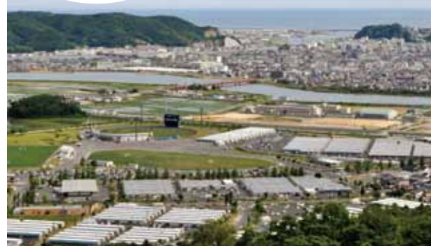
仮設住宅（東北最大の開成団地）