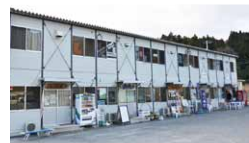
2011年11月にオープンした仮設商店街おがつ店こ屋街（雄勝）