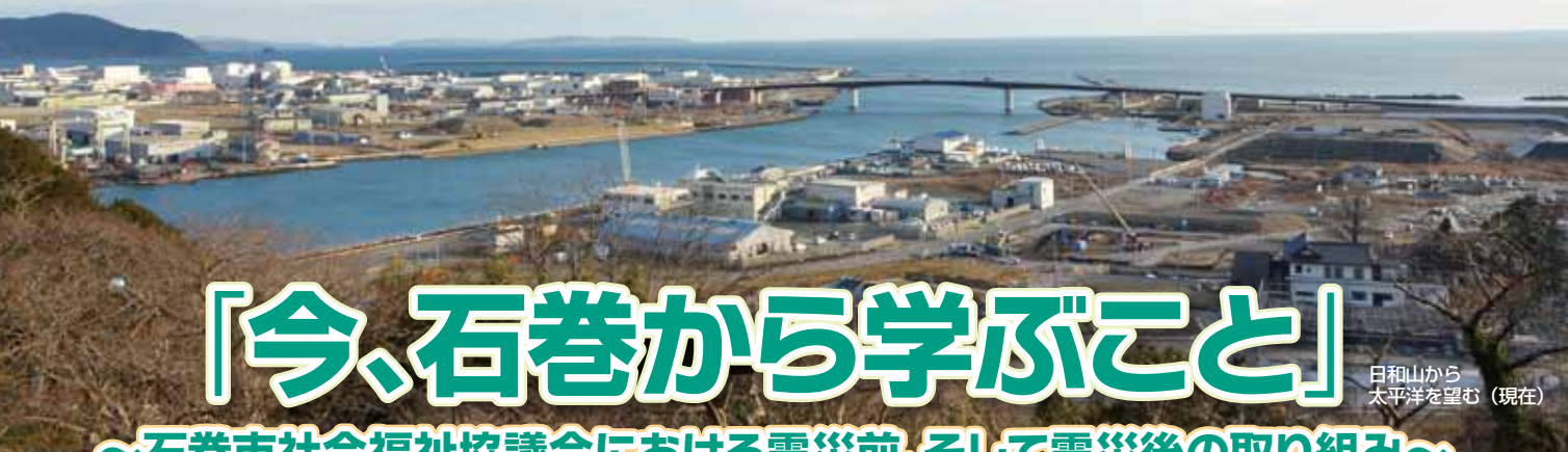
日和山から太平洋を望む（現在）