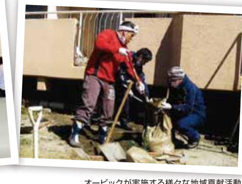
オービックが実施する様々な地域貢献活動

アメフトは試合会場に限られ、これまでは主に川崎市の球場で公式戦を開催していました。しかし、地域に根ざしたチームを目指しているオービックは地元開催に向けて動き出し、平成21年から24年までは千葉市のQVCマリフィールド（旧千葉マリスタジアム）で年1回ずつ公式戦を開催。25年からは念願だった習志野市の秋津サッカー場で年1回開催しています。「とにかく地元の方にアメフトの試合を見てもらいたかった。いざ地元で開催してみたら、フラッグフッ