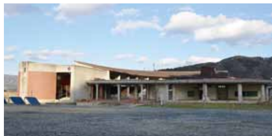
大川小学校旧校舎

こうなんだろうな、じゃあ社協の役割ってなんだろうと。社協の仲間にも聞いてみて「そうか、やっぱり」「じゃあ、これやんなきゃいけないよな」とか。そして自分たちで始めよう、となったのです。社協には仲間がいるわけですよ。一緒に訓練をやり、住民の前で寸劇してきた仲間が。同じベクトルを持っている仲間がいて、「やっぱり、そうだよな」って話をしながら地域を歩くことをしました。