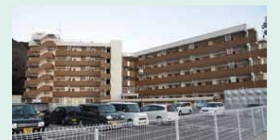
完成した復興公営住宅

石巻では仮設住宅から復興公営住宅に移行する時期を迎えており、被災者支援だけでなく、地域全体のコミュニティづくりというものを考えていく必要があ