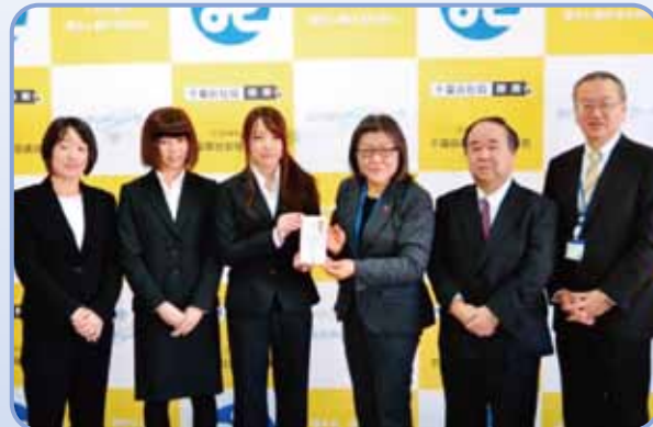
東京成徳大学の皆様（左側3名）と本会役員

本会では大学生によるボランティア活動の推進をはじめ、学生との協働事業なども進めています。こうした若い世代の積極的な取り組みに敬意を表すとともに、今後