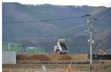
北上川堤防のかさ上げ工事

阿部：震災前は高齢の親と子の2世代、あるいは孫との3世代が一軒家で同居していたのに、一旦仮設住宅へ入居した場合、手狭なため、隣り合わせで2部屋借りたりします。でも、そういった家族が仮設住宅を出る時には、高齢の親と、子