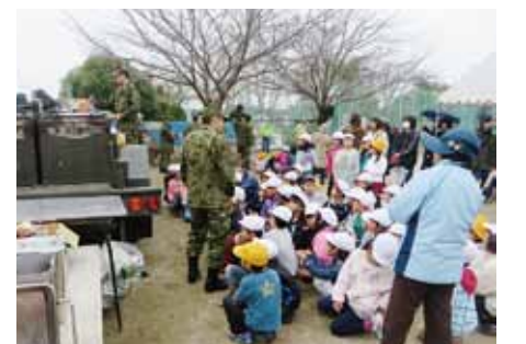
自衛隊によるカレーの炊き出し

タイアップして、授業参観の日に避難訓練や引き渡し訓練を実施するなど工夫しています。また、自衛隊にも参加してもらい、実際の炊き出しの様子を見学するなど、昨年は約900名の参加がありました。