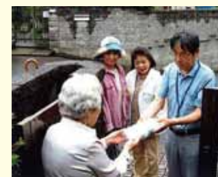
友愛訪問(流山市東深井中学校区児童協)

(お問合せ先) お近くの民生委員・児童委員をお知りになりたい方は、市町村役場の民生委員担当課までご連絡ください。その他、民生委員に関することは、(公財)千葉県民生委員児童委員協議会(043-246-6011)までお問い合わせください。