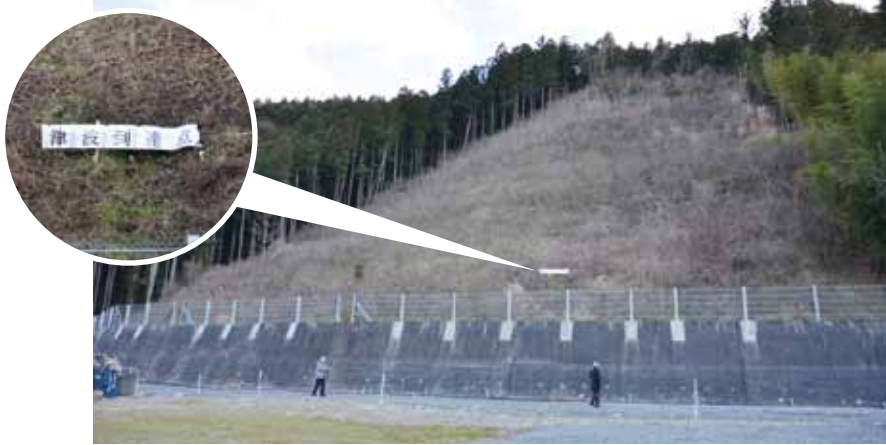
大川小学校旧校舎の裏山