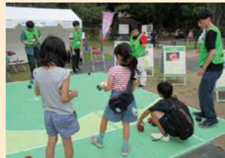
大賀ハス祭りボランティア(ポッチャ普及活動)

事実、取材に応じてくれた高校生たちからも、「大学生と知り合えたり、お互いに協力し合えるのは、私たちにとって貴重な体験です」「ボランティア活動において、とても頼りになる存在です」といった言葉が聞かれました。「ボランティア活動は“自分が地域社会の中で生きている”と実感できます。それは、高校生にとってとても大切なのです」と石井先