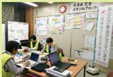
災害ボランティアセンターに拠出された「赤い羽根募金のぼり」

大きな災害時、被災した家屋の片付けや、被災者の安全確認や生活基盤の確保など、行政の手がすぐには行き届かない部分で支援を必要としている方がたくさんいます。こうした支援ニーズを解決する活動に、皆さまから寄せいただいた共同募金が使われます。地域福祉の推進のための共同募金は、皆さまの身近なところで活躍しています。