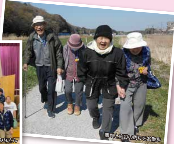
職員と施設の周りをお散歩