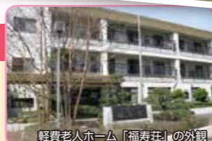
軽費老人ホーム「福寿荘」の外観