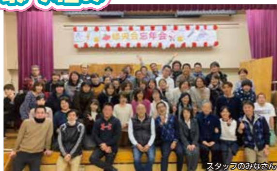
スタッフのみなさん