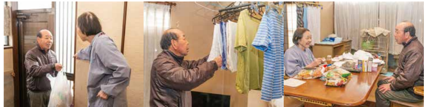
買い物のほかに、洗濯物を干したり、おしゃべりをするのも家事援助の大切な役割です。

ジャーや民生委員などにも周知しました。現在の利用会員は9名でそのほとんどが高齢者です。