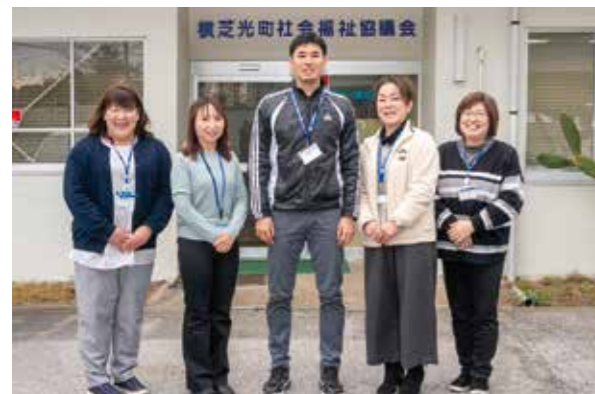
横芝光町社協のみなさん