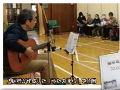
入居者が作成した「うたのほん」で合唱