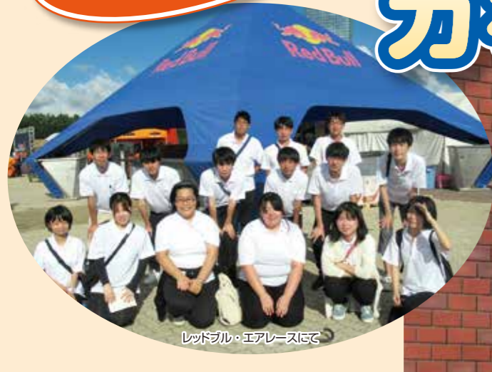
レッドブル・エアレースにて

2018年12月、千葉経済大学、千葉経済大学短期大学部、千葉経済大学附属高等学校が、合同で「千葉経済学園ボランティアセンター」(以下、千葉経済学園VC)を開設。以降、様々なボランティア活動に、3校が力を合わせて取り組んでいます。そこで今回は、千葉経済学園VCを設立した理由や、それにより学園のボランティア活動がどのように変化したかなど、詳しくお聞きしました。