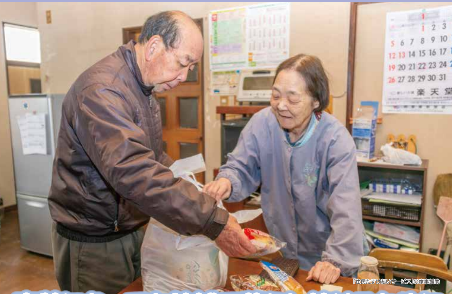
【住民たすけあいサービス】の家事援助