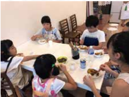
子ども食堂で食券配布事業 【我孫子市】