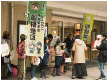
ポースカウトによる街頭募金活動 【船橋市】