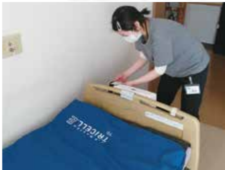
利用者の褥瘡を防ぐエアマットの購入 【香取市】