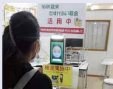
地域活動支援センターの 新型コロナウイルス感染症対策の備品購入【我孫子市】