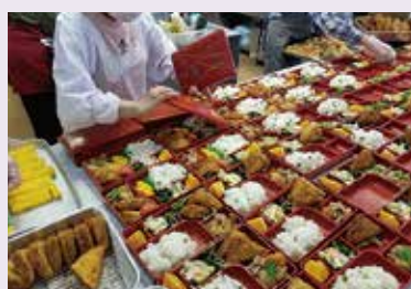
独居高齢者宅等へのお弁当配布事業 【我孫子市】