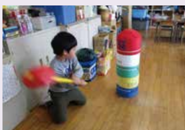
子どもたちの居場所づくりや 地域サロンの活動用に備品整備【栄町】 ※令和元年12月から令和2年2月に実施した事業です