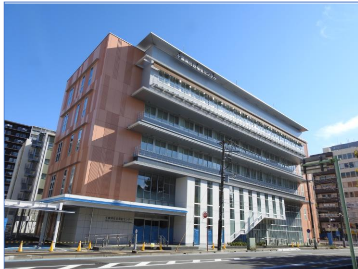
令和5年4月にオープンした千葉県社会福祉センターの外観